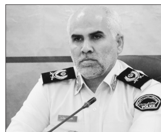
فرمانده سابق انتظامی استان هرمزگان از اجرای

طرح ضربتی ارتقاء امنیت اجتماعی و دستگیری ۱۸ اخلاک‌گر نظم عمومی در استان خبر داد. سردار غلامرضا جعفری، در تشریح این خبر بیان کرد: با هدف پاسخگویی به مطالبات و درخواست های شهروندان مبنی بر برخورد با برهم‌زنندگان نظم عمومی، پیگیری موضوع بصورت ویژه در دستور کار قرار گرفت. وی افزود: با تلاش همه جانبه ماموران پلیس امنیت عمومی استان و به منظور پاکسازی نقاط و محلات آلوده، طرح ضربتی ارتقاء امنیت اجتماعی در قالب طرح