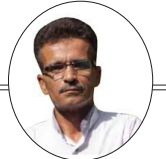
به قلم : غلامعباس شمس الدینی