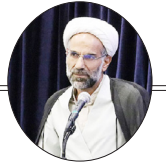
به قلم : دکتر عباس فضل