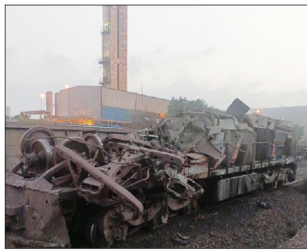
بر اثر وقوع یک سانحه برای قطار باری در بندرعباس یک لکوموتیوران

خبرنگار برای پیگیری این حادثه با روابط عمومی راه آهن استان هرمزگان تماس گرفت که روابط عمومی از هرگونه اظهار نظر درباره چگونگی این سانحه خودداری و اعلام کرد: "روایات مختلف این حادثه در دست پیگیری است و تیم فنی راه آهن هنوز نظر قطعی خود را گزارش نکرده است. این در حالی است که انتظار می رفت در راستای شفاف سازی، راه آهن با صدور اطلاعیه نسبت به این سانحه اطلاع رسانی