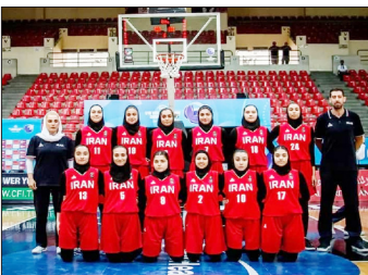
تیم ملی بسکتبال دختران ایران با همراهی ورزشکار هرمزگانی، در فینال مسابقات آسیایی با شکست برابر

فیلیپین برای نخستین بار نایب قهرمان آسیا شد. تیم بسکتبال دختران زیر ۱۶ سال ایران رقابت‌های کاپ آسیا دیویژن B را با چهار پیروزی در مراحل مقدماتی و نیمه نهایی پشت سر گذاشت و با شکست ۸۳ بر ۶۰ برابر فیلیپین در دیدار فینال، نایب قهرمان آسیا شدند. تیم بسکتبال دختران زیر ۱۶ سال ایران برای اولین بار به عنوان یک تیم بانوان ایرانی در رقابت‌های آسیایی در این رشته عنوان نایب قهرمانی را به ارمان آورده‌اند. تیم که با شایستگی ملازی، سنگاپور و گوم را در مرحله گروهی شکست داد در برابر هنگ کنگ در مرحله نیمه نهایی پیروز شد و یکشنبه شب در دیدار پایانی، نتیجه را