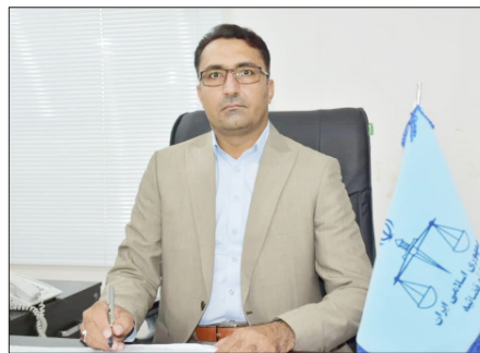
رئیس کل دادگستری هرمزگان گفت: طرح «پرداخت دیه تصادفات

رئیس کل دادگستری هرمزگان تصریح کرد: در نتیجه اجرای این طرح ۲۲۵ فقره پرونده به شرکت‌های بیمه ارجاع شده که تاکنون در ۱۰۰