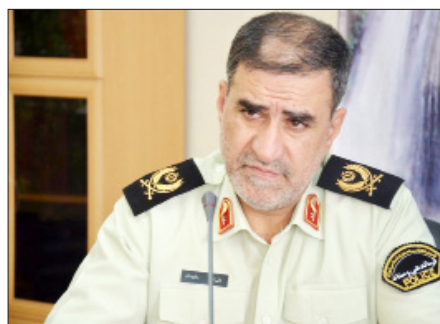
فرمانده انتظامی هرمزگان گفت: با هوشیاری و تلاش همه‌جانبه کارآگاهان پلیس آگاهی استان ۲ آدم‌ربا دستگیر و گروگان ۳۰ ساله آزاد

وی بیان کرد: بنا به اقرار خانواده مفقودی، بعد از گذشت چند روز از سوی افرادی ناشناس با استفاده خط تلفن همراه مجازی متعلق به یکی از کشورهای همسایه با اعضای خانواده وی ارتباط برقرار کرده و تقاضای مبلغ ۱۰ میلیارد تومان وجه نقد در قبال آزادی وی می‌کنند که باتوجه به اهمیت و حساسیت موضوع، مراتب به صورت ویژه در دستور کار کارآگاهان اداره مبارزه با جرایم جنایی آگاهی استان قرار گرفت. این