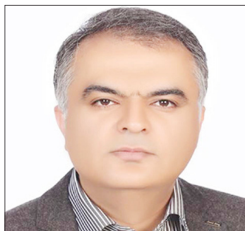
بیماری کیست پانکراس بدون عمل جراحی باز و با روش