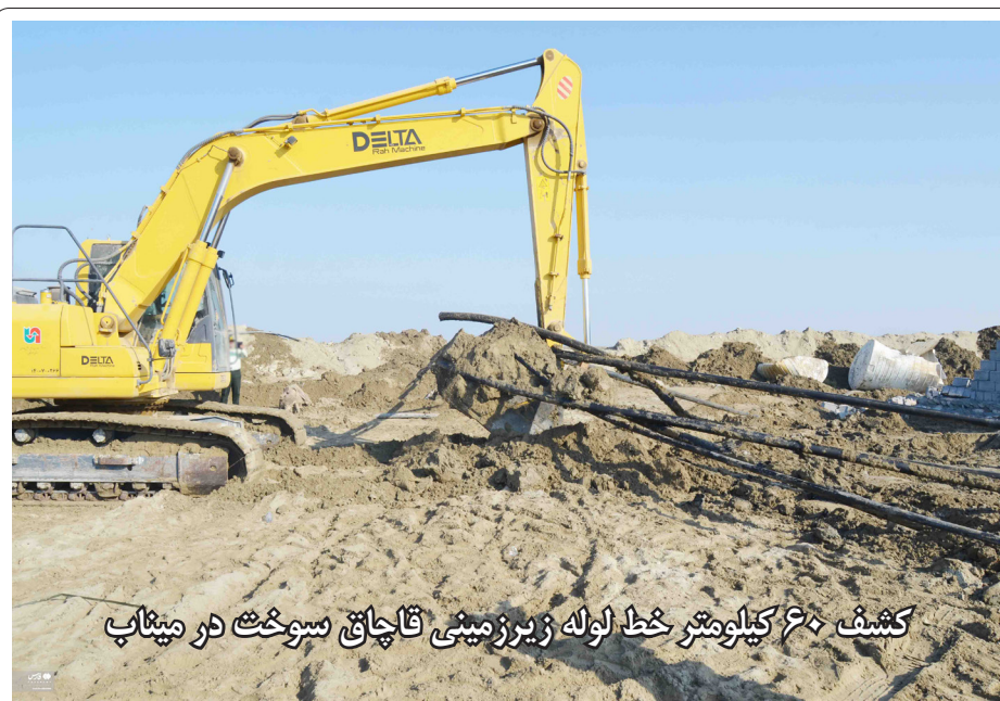
کشف ۶۰ کیلومتر خط لوله زیرزمینی قالیچاق سوخت در میناب