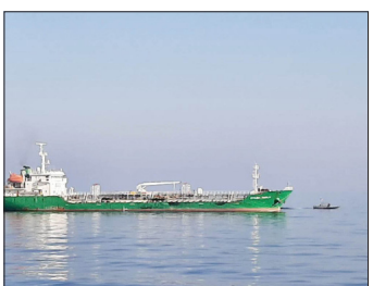
نیروهای مسلح با اقتدار در حال انجام است.

رزمندگان منطقه پنجم امام محمد باقر (ع) نیروی دریایی سپاه دو شناور حامل ۴ میلیون و ۵۰۰ هزار لیتر سوخت قاچاق را در جنوب جزیره بوموسی توقیف کرد. فرمانده منطقه پنجم نیروی دریایی سپاه گفت: این سوخت‌ها در سه روز رصد و اشراف اطلاعاتی، در یک اقدام ضربتی و غافلگیرانه کشف شد. دریادار علی عظمایی افزود: یکی از این دو کشتی با دو میلیون و ۲۸۰ هزار لیتر سوخت قاچاق و ۱۳ خدمه خارجی در جنوب جزیره بوموسی، و کشتی دیگر نیز با حدود دو میلیون و ۳۰۰ هزار لیتر سوخت قاچاق و ۲۱ نفر