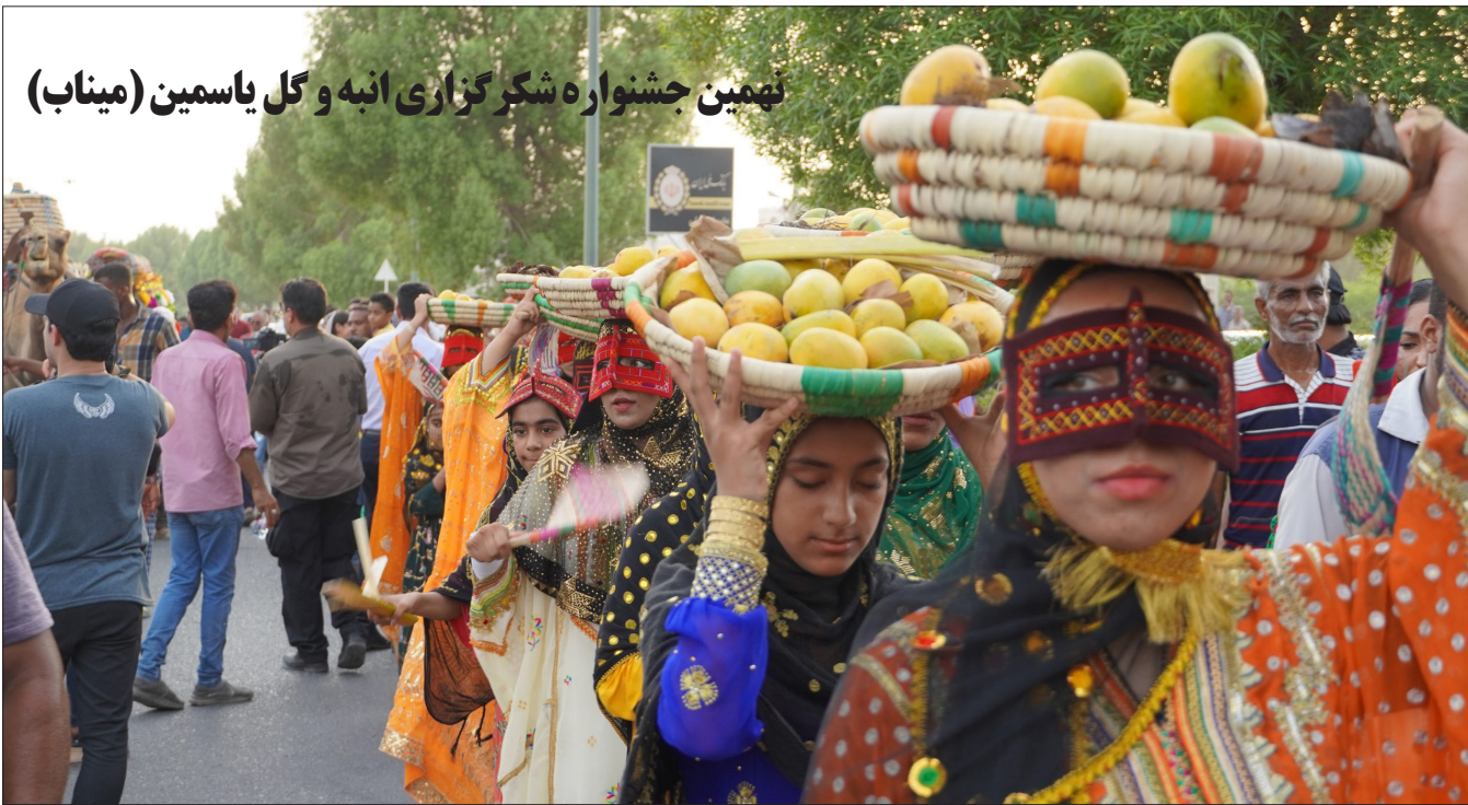
نهمین جشنواره شکرگزاری انبه و گل یاسمین (میناب)