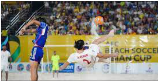
لیگ برتر فوتبال ساحلی بانوان هرمزگان

نمایندگان هرمزگان در هفته هشتم لیگ برتر فوتبال ساحلی کشور برابر حریفان خود نتیجه را واگذار کردند. تیم شهرداری بندرعباس در ورزشگاه غدیر بندرعباس، میزبان تیم چادرملو اردکان بود که با نتیجه پر گل ۸ بر ۳ مغلوب شد. تیم فولاد هرمزگان دیگر نماینده استان در این مسابقات نیز با نتیجه هشت بر ۶ مقابل پارس جنوبی شکست خورد. با این نتیجه