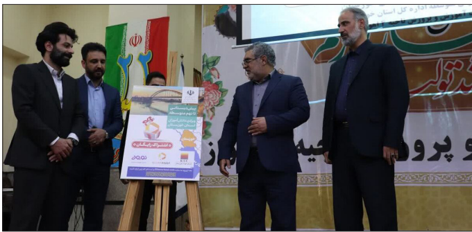
بهره برداری از نیروگاه این اقدامات انجام شود. رئیس سازمان انرژی اتمی افزود: یکی از معضلات بزرگ هرمزگان افت نخیلات است که در چهار ماه گذشته اولین سامانه پرتودهی برای گرفتن افت از نخیلات رونمایی شده

به درختان، قادر است تخم، لارو و سوسک سرخرطومی را از بین ببرد. از جمله قابلیت های این سامانه می توان به ایجاد حلقه موج با توان تابشی KW12 و بالاتر هیدرولیک با قابلیت جابجایی تا ارتفاع ۱۰ متر و سامانه خنک کننده اشاره کرد. در مناطق جنوب کشور، طی سال های اخیر یک آفت وارداتی موجب آسیب به درختان نخل شده که ادامه این روند و عدم کنترل آن منجر به تخریب همه نخلستان های کشور می شود؛ بنابراین هدف از ساخت این سامانه، کنترل آفت سوسک سرخرطومی خرما، کاهش مصرف سموم، حذف باقیمانده سموم در محصولات و استفاده صلح آمیز انرژی هسته ای مبتنی بر دانش روز و سازگار با محیط زیست است