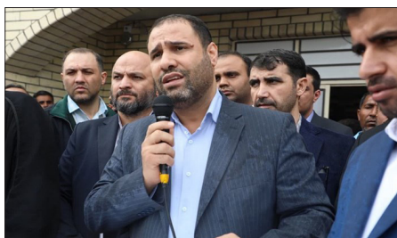
عزیز بگویم که ایشان قول دادند در اولین فرصت حتما سفری به استان هرمزگان داشته باشند و این سفر را حتما انجام خواهند داد

رئیس جمهور که قرار بود راهی بشاگرد شود، به دلیل شرایط نامناسب جوی نتوانست در میان مردم این منطقه حاضر شود و وزیر آموزش و پرورش به نمایندگی از رئیس جمهور در میان مردم این منطقه حاضر شد. وزیر آموزش و پرورش با حضور در جمع اهالی بشاگرد که برای استقبال از رییس جمهور گردهم آمده بودند، اظهار کرد: رییس جمهور دو مرتبه شرایط سفر به منطقه بشاگرد را بررسی کردند و تیم پروازی ایشان بدلیل شرایط نامناسب آب و هوایی و بارندگی شدید، امکان پرواز نیافتند. وی افزود: بنده به نمایندگی از رییس جمهور و از ساعت ۴ صبح راهی بشاگرد شده ام تا ضمن ابلاغ سلام گرم ایشان به شما مردم