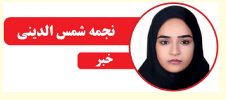
نجمه شمس الدینی خبر